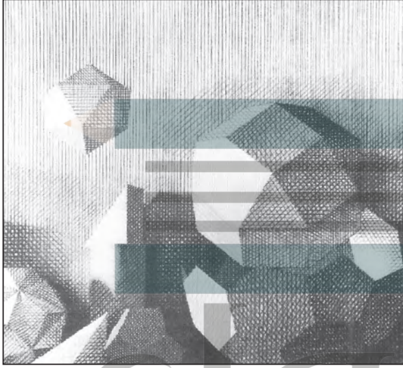
الشكل (٤) الفنان وليم بيري.