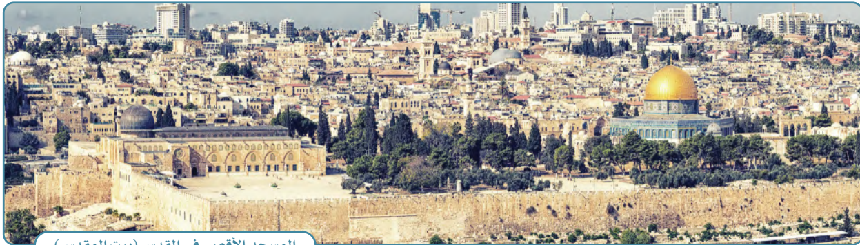
المسجد الأقصى في القدس (بيت المقدس)